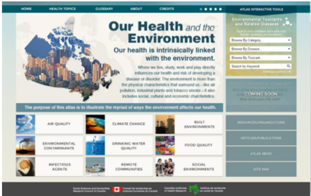
Fig.1. Representación gráfica del objeto de estudio de la Salud ambiental y sus facetas tomado de: Social Sciences and Humanities Research Council/Canadian Institutes of Health Research (2014).

externos a una persona y todos los factores relacionados que impactan los comportamientos; abarcando la evaluación y control de los principales factores ambientales que potencialmente pueden afectar la salud y se dirige a la prevención de enfermedades y la creación de entornos saludables. Por otro lado también se precisa el objeto de estudio de la de Salud Ambiental como lo define el Instituto Nacional de Salud Pública (2014): "...es el proceso de salud-enfermedad, observando y analizando sus determinantes (biológicos, sociales, políticos, económicos, culturales, etc.) y que al ser bien identificados permitan coadyuvar en la búsqueda de respuestas sociales para resolverlos. En la figura 1 se presenta gráficamente el objeto de estudio de la salud ambiental y sus facetas.