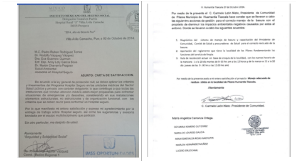
Fig. 5. Algunas cartas de satisfacción de los usuarios por el desarrollo de proyectos de salud ambiental y ocupacional en sus respectivas empresas o instituciones.