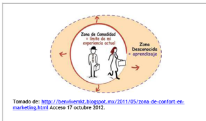
Fig. 3. Esquema de abordaje hacia la zona de aprendizaje situado

Debido al estereotipo de roles que al principio afloran en algunos de mis alumnos de querer permanecer en una realidad conocida o zona de confort. En la figura 3 se muestra esquemáticamente como se ha superado esta situación ganando la confianza de los alumnos, reforzando las habilidades básicas del campo de estudio y siguiendo estrategias de educación facultadora, enseñanza – aprendizaje situado, aprendizaje centrado en solución de problemas para finalmente tener inmersión en la estrategia de proyectos