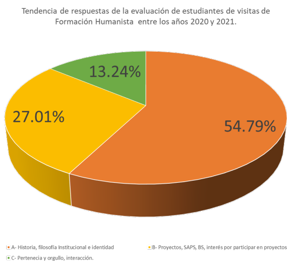
Gráfica 1. Tendencia de respuesta de estudiantes de Formación Humanista años 2020-2021.

Adicionalmente, para conocer la percepción de los estudiantes se diseñó una herramienta de evaluación cuantitativa y cualitativa en formato de Google forms; el diseño y aplicación de la herramienta se ha modificado levemente en tres ocasiones. Un primer diseño buscó conocer los temas de interés para el estudiante, así que además de recoger datos estadísticos de número de alumnos asistentes, materia y grupo, se preguntó ¿Cuál es el tema que más te interesó? y ¿Por qué? Los resultados de este primer ejercicio mostraron que un 59% tenía interés por la historia y el 27% se interesó por los proyectos solidarios presentados y un 13% mostró expresiones de pertenencia y orgullo, es importante aclarar que, en visita de dos de las materias, el tema central es la historia de la universidad. Esta evaluación se aplicó a 2202 estudiantes que tuvieron la visita en línea en el ciclo escolar 2019-2020 a partir del período de primavera, y el ciclo escolar 2020-2021 tiempo de confinamiento por pandemia del Sars-COVID 19 (gráfica 1).