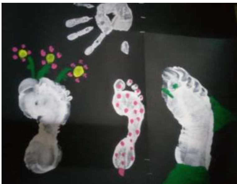
Ilustración 2 Pinto con mi cuerpo, técnica: acrílica. Actividad familiar. (López, M., 2020, Recopilación personal).

Tanto “Viajeros en el tiempo” como “Diálogos de crianza” tuvieron un sustento teórico sólido, el cual se detalla a continuación.