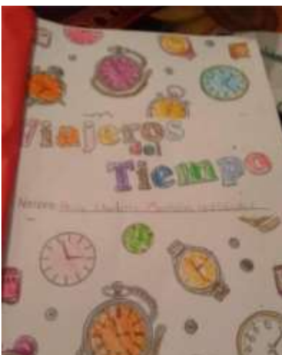
Ilustración 3 Portada de Álbum del Viajero, por Heily. (López, M., 2020, Recopilación personal).

También nos enfrentamos a problemas derivados de la conectividad, tanto los moderadores como los participantes, incluso a que el seguimiento de instrucciones se viera obstaculizado, sobre todo para los más pequeños; sin embargo, estas cuestiones pudieron solventarse, gracias al seguimiento que se llevaba a cabo a través de un grupo de whatsapp y de facebook, creados para tal fin.